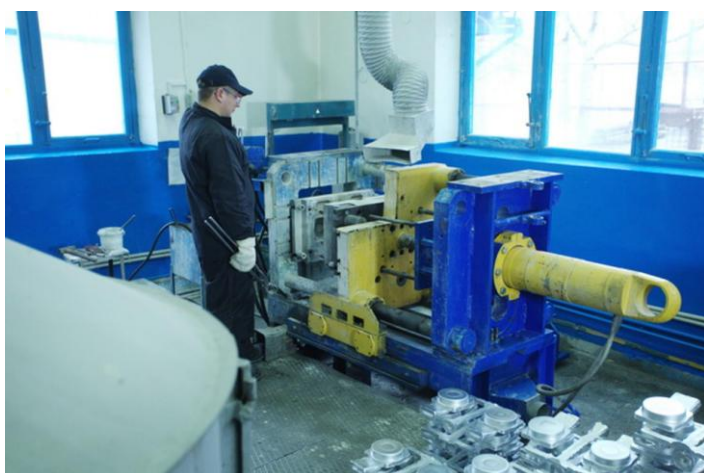
Литье в кокиль.