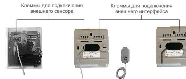
С выносным сенсором